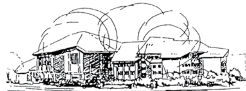
RUDOLF STEINER SCHULE HAMBURG-WANDSBEEK